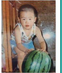
両親は共働きで、 同居する祖父母にも 育ててもらいました