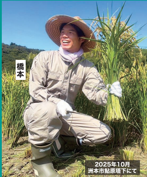
2025年10月 洲本市鮎原塔下にて

これまでの政府与党の減反政策等で、 コメ不足や急激な価格高騰に陥りました。 消費者を守り、生産者も守るため、 農地 直接支払の実施や兼業、小規模農家も 応援し、食糧の安全を守り自給率を向上 させます! 農業、農家への政府支出をもっと増やす べきです!