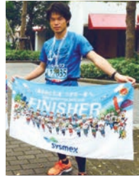
神戸マラソン完走 今年も走ります！

幼少期から活発で、泥まみれで帰宅するなど、走り回ることが大好きなやんちゃ坊主！ 小学校では、学年ごとのマラソン大会で6年連続1位。 サッカーにも出会い、社会人になった現在も競技を続けています。 学生時代を通して文武両道を目指し、勉強も部活も必死に取り組みました。 また、神戸マラソン、大阪マラソンなどで、フルマラソン5回、ハーフマラソン10回完走！ 体力、気力に自信あり！ 市民目線の議員として全力で働きます！