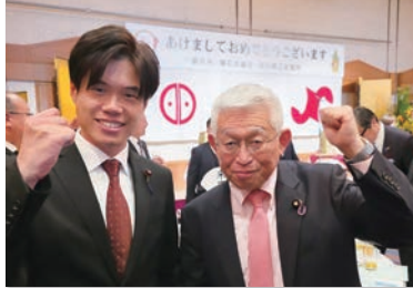
明石市新年交歓会にて泉房穂参議院議員と。 今後もしっかりと連携し、 明石でできた政策を国で実行します！