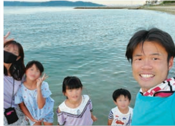
明石と淡路島の美しい海が大好きです！ 明石の海岸、豊野松原や福良などにも 家族とよく行きます