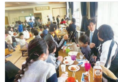
明石、淡路島の各地の子ども食堂を訪問。 地域それぞれの課題や 様々なご意見を伺っています。

規模の大小に関わらず、明石・淡路島の地域の各種集まりやイベント、お祭りなどに参加。地域の方々と直接お話しし、今の課題や政治への期待などをお聞きできる このような機会が、本当に貴重です！開催情報やご招待など、お気軽にご連絡ください。