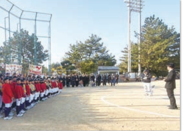
地元の野球チームの卒団式にて ご挨拶させていただきました。 子どもたちの夢や可能性を支えてまいります。