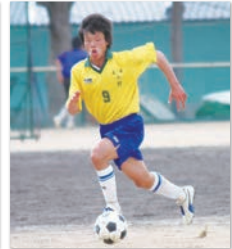
小学生の頃から現在まで 競技を続けているサッカー