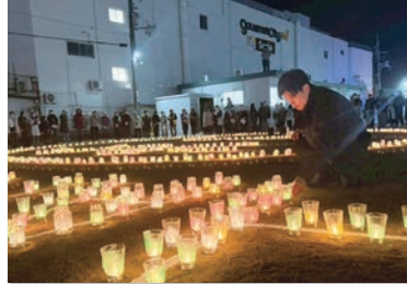
阪神淡路大震災から31年、 西明石駅前での追悼集会に参加。 震災の教訓をしっかり次世代へ繋いでいくと誓う。