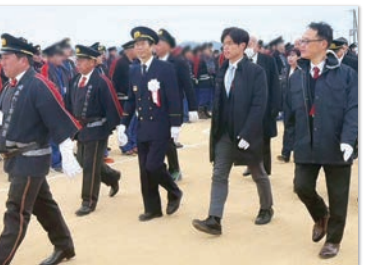
南あわじ市消防団初出式に参加。 有事のみならず平時も、操法訓練や地域での 様々な活動に心から敬意を表します。