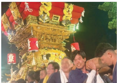
明石、淡路島各地のお祭りにも参加。 (写真は明石市鳥羽の秋祭り) 各地で仲間に入れていただき感謝いたします。