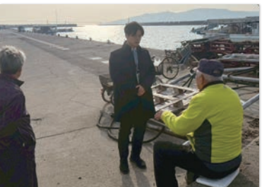
明石市林崎漁港にて漁師の方々に お話を伺いました。 豊かな漁業資源のためにも尽力します。