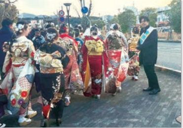
「洲本市はたちのつどい」にて。 若者が未来に希望を持ち、信頼し助け合える 社会を創るために全力で頑張ります。