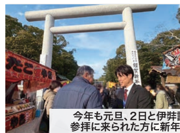
今年も元旦、2日と伊弉諾神社に参らせていただき、 参拝に来られた方に新年のご挨拶を申し上げます。