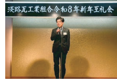
淡路瓦工業組合新年互礼会にて。 淡路島の産業、経済の発展のために 様々な可能性を皆さんと考えていきます。