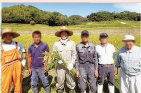
洲本市鮎原塔下の農家の方々と