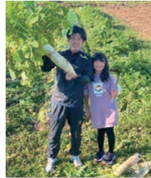
実家の畑にて大根を収穫 農業の大切さを理解し、 農家の方々の暮らしを守ります！