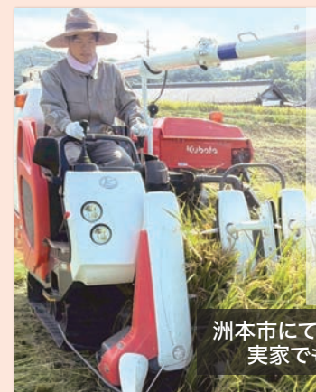
洲本市にてコンバインで稲刈りに参加 実家でもよく手伝っていました