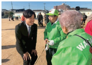
明石市和坂校区の左義長に参加。 お集まりの地域の方々に地域の安全や 防災についてご意見を伺いました。